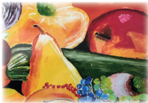
Ulrich Sigmund, Schlammersdorf