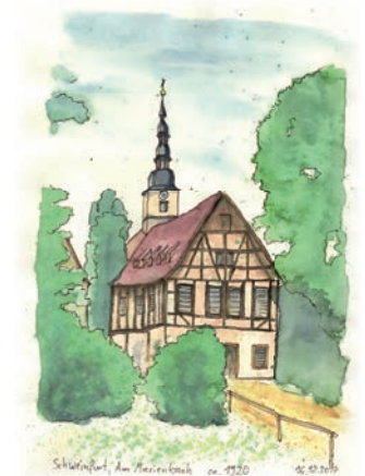
Axel Weisenberger Werneck