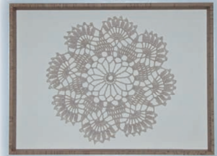
Gerlinde Nagengast Eggolsheim