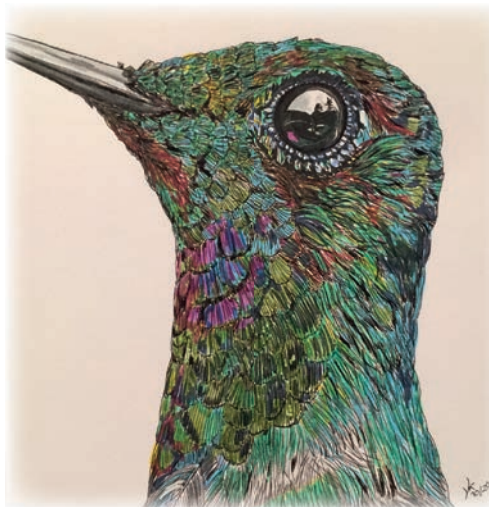
Yvonne Krauß Forchheim